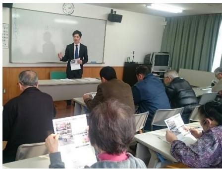
(実況コミュニティーセンターでの様子)