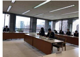
県職員を呼んで県民投票条例案についての勉強会を実施