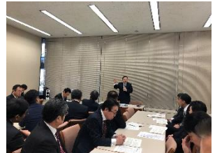
東北大学より専門家をお招きして勉強会を実施