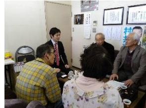
条例制定推進泉区連絡会の皆様と意見交換を実施