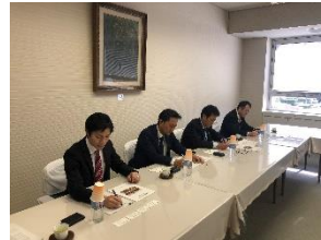
新潟県での県民投票条例の直接請求への対応について調査

女川原発の再稼働の是非を問う県民投票条例を求める直接請求が宮城県に提出され、21日には村井知事より議会に対して議案が上程されます。11万を超える署名の重みをしっかりと受け止め、慎重かつ丁寧な議論を重ねて参ります。