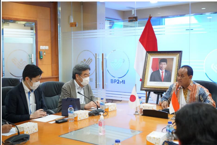
Audiensi dengan Pemerintah Prefektur Miyagi Jepang, BP2MI Ingin Ada Penambahan Kuota PMI dan Perluasan Sektor Kerja.