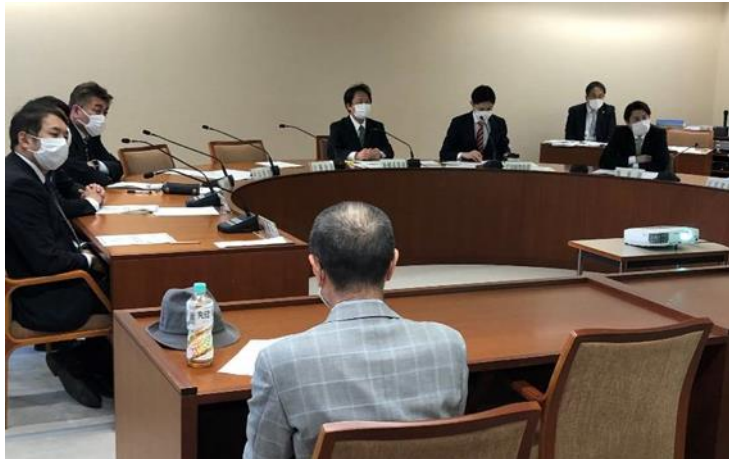
↑ 地方デジタル化調査特別委員会の様子。