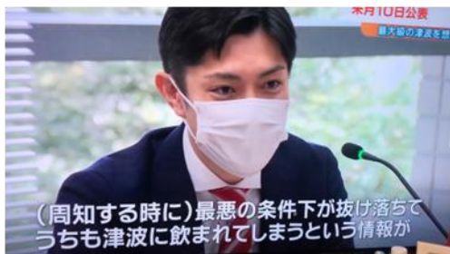
(周知する時に)最悪の条件下が抜け落ちてうちも津波に飲まれてしまうという情報が

新たな津波浸水想定公表に際し、建設企業委員会で執行部への指摘の様子が地元テレビにて報道される。