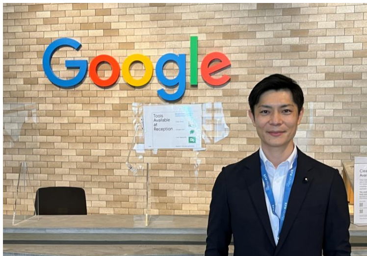
↑地方デジタル化調査特別委員会でgoogleを訪問。